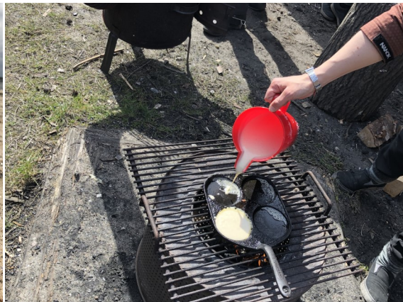
Der laves pandekager ved bålhytten.