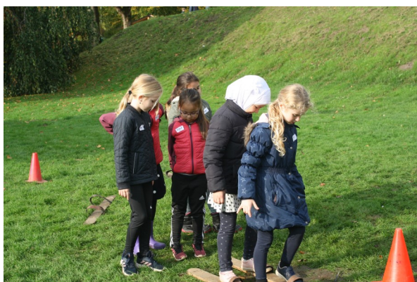
OL i gamle lege ved Skive Museum

I juli måned er der sommerferieklub på Brårup Fritidscenter. Hertil er der speciel tilmelding.