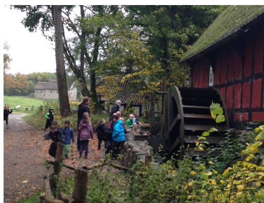
Tur til Hjerl hede