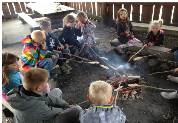
Der bages snobrød i vores bålhytte.

Vi vil meget gerne have, at I bruger dette system frem for at sende besked om det via Aula, eller at ringe til os om, at barnet skal sendes hjem.