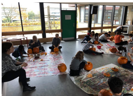
Der laves græskar til halloween.