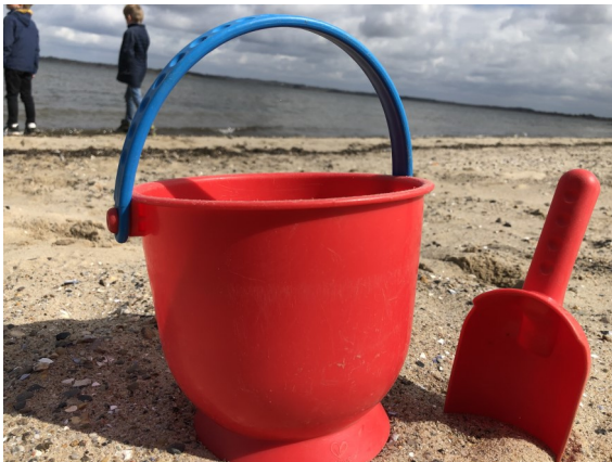
Tur med skolens bus til Strandtangen.