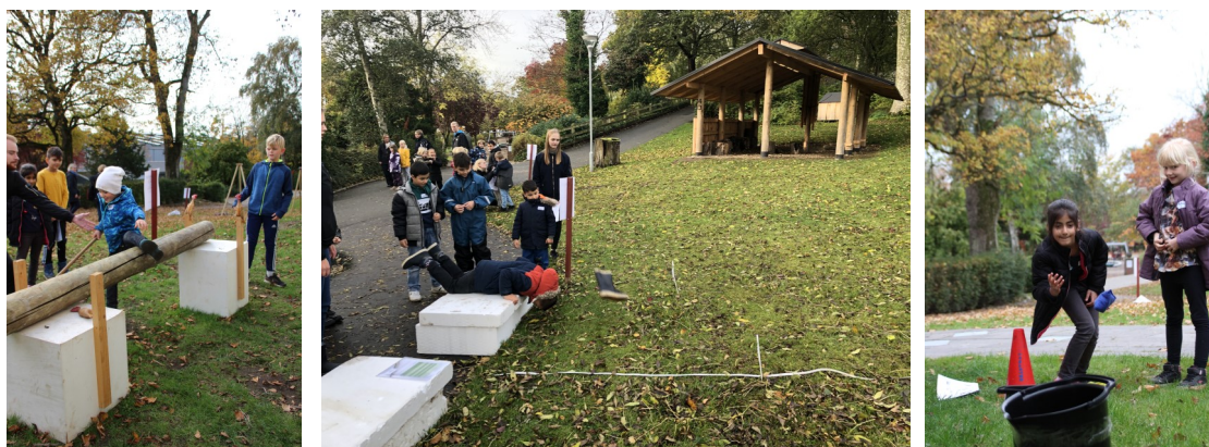
OL i gamle lege ved Skive Museum.

Der vil i årets løb blive lavet forskellige kreative værksteder, hvor en masse forskellige materialer vil blive brugt. F.eks. laver vi maleværksted, krympeplader, emner om årstidene, ler, julegaver, vinduesmaling, stofdukker og smykkeværksted.